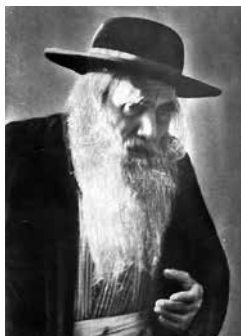
הרב חיים יוסף זוננפלד