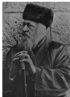
הרב יוסף צבי דושינסקי