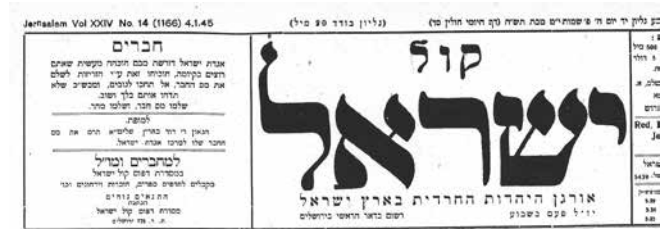
כותרת קול ישראל

עם סיומה של השביתה החל העיתון לדווח על ועדת החקירה שקמה בעקבותיה, בראשות הלורד ויליאם רוברט פיל (Peel), ועל השתתפותה של אגודת ישראל בדיוניה. 87 בדיעה מיוחדת התבשר הציבור החרדי בירושלים על איחוד בין בתי הדין של הפרושים ושל החסידים ועל הקמתה של העדה החרדית, שהחליפה את ועד העיר האשכנזי כארגון החרדים הלא-צייונים בירושלים. 88 העיתון התרכז בשלושה נושאים עיקריים. הראשון, חידוש פעילותו של ארגון הצעירים. 89 הנושא השני עסק בדיווח על הקמת מוסדותיה של העדה החרדית ועל הזמנתו של