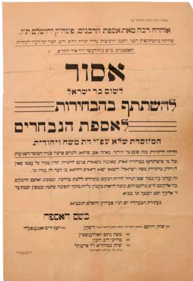
איסור הרבנים על השתתפות בבחירות