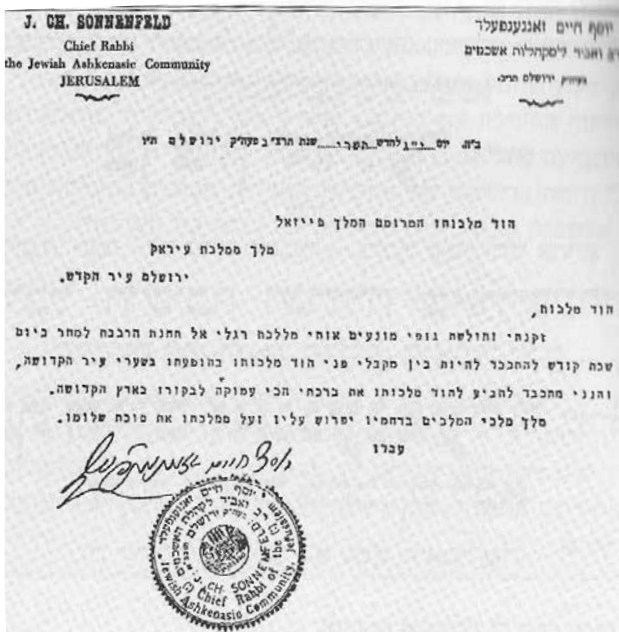
מכתבו של הרב זוננפלד למלך פייסל