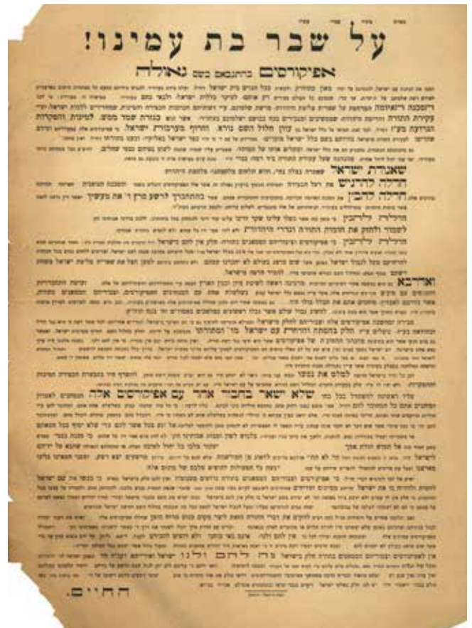
אגודת החיים (נטורי קרתא) נגד אגודת ישראל

חרף השינויים הרבים שעבר שוק העיתונות העברית בארץ ישראל, שמר העיתון על הפורמט שבו הופיע לראשונה. הוא המשיך ויצא לאור פעם בשבוע, שמר בדרך כלל על פורמט של ארבעה עמודים בשינויים קלים בלבד בעיצוב הכותרת והעימוד או בטווח הנושאים שכיסה. בדרך כלל לא הביא העיתון ידיעות חדשותיות מדיניות, חברתיות או כלכליות שלא היו קשורות באופן ישיר לציבור החרדי. 9 משמעות הדבר הייתה כי לאותם אנשים שהסתפקו בקריאת עיתון זה הייתה הבנה מוגבלת מאוד על המתרחש בעולם הרחב, ואלה מן הקוראים שביקשו להרחיב את אופק ידיעותיהם, נאלצו לעיין בעיתונים נוספים. אף שהדיון בצורך בקיומו של עיתון חדשותי יומי החל כבר בתחילת שנות השלושים, 10 רק בסוף שנת 1948, מעט לאחר קום המדינה, החליטה אגודת ישראל להקים את היומון המבשר , ובמקביל לכך הופסקה הוצאתו לאור של קול ישראל הוותיק. 11