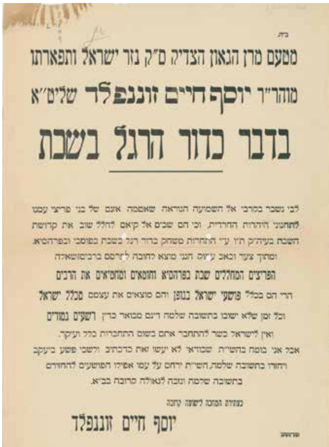
כרוז נגד משחק כדורגל בשבת