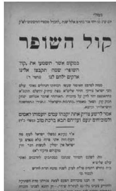
קול השופר נגד ספרו של הרב קוק

מסיבות ציוניות מוצהרות, הם לא מצאו סיבה להיכבד מכלל היישוב היהודי בארץ ישראל. 68 פרנסי התנועה ביקשו שממלא מקומו של הרב זוננפלד יהיה מי שמחד גיסא ימציא דרך לשמר את מעמדה הברדלני, ומאידך גיסא ירחיב את מעגל המצטרפים לאגודת ישראל, שהפערים האידיאולוגיים בתוכה הלכו וגברו.