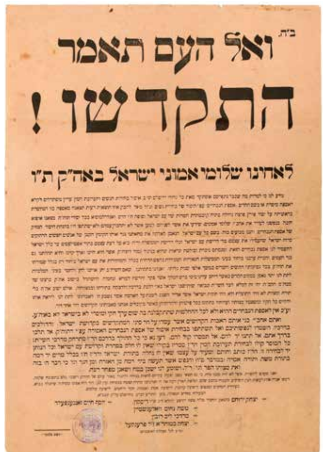
איסור הרבנים על השתתפות נשים בבחירות

בעקבות מלחמת העולם הראשונה והשינויים הרבים שהתרחשו בעקבותיה, ולאחר בחירתו של הרב זוננפלד לעמוד בראש הנהגת היישוב הישן, התברר כי בהשראתו קנתה תפיסת ההתבדלות ה"הונגרית" מקום גדל והולך. הדבר לא התרחש ביום אחד. המהלך החל בשנת 1918, בעת בחירתו של ועד מייצג ליהודי ירושלים. נציגיהם של רוב הקבוצות היהודיות הקימו את "ועד העיר הכללי", בעוד קבוצות אחרות, ובהן גם חלק מבני היישוב הישן אך גם מתנגדים אחרים של ההנהגה הציונית, הקימו ארגון אופוזיציוני בשם "ועד העיר האשכנזי". זמן קצר לאחר מכן החלה מחלוקת בשאלת התנהלותו של ועד העיר האשכנזי שהסתיימה עם פרישתם של הגורמים המתונים יותר בארגון. בהנהגתו של הרב זוננפלד, שהיה משנת 1919 למנהיגו הרוחני והפוליטי, היה ועד העיר האשכנזי למייצגם הבולט של אותם בני היישוב הישן אשר ויתרו למעשה על עקרון כלל ישראל. בתהליך מורכב ורב ממדי נפרמו הקשרים החברתיים, הדתיים, הפוליטיים והכלכליים שבין ועד העיר האשכנזי לוועד העיר הכללי. קרע זה חצה גם את בני היישוב הישן עצמם. חרף הקשיים האידאולוגיים היו מי שהמשיכו לראות עצמם כחלק מכלל העם היהודי היושב בציון,